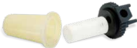
Prototype fonctionnel de filtre imprimé en plastiques rigides transparent, blanc et noir

La précision des pièces et les performances des matériaux sont parfaitement adaptées aux applications d'outillage rapide