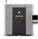
sPro 60 HD-HS