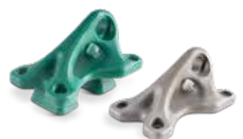
Fournissez des composants plus performants et plus économiques grâce à l'optimisation de la topologie et à la consolidation des pièces.