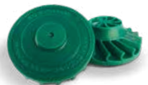
Production de composants sur mesure ou de petites séries sans le coût et le délai de l'outillage

Rationalisez votre flux de production, du fichier jusqu'au modèle, grâce aux fonctionnalités avancées du logiciel 3D Sprint® pour la préparation et la gestion du processus de fabrication additive, à l'impression grande vitesse sans surveillance et à une méthodologie post-traitement définie et contrôlée. La simplicité d'utilisation et la fiabilité du processus d'impression Multijet garantissent des performances, un rendement et des résultats sur lesquels on peut compter.