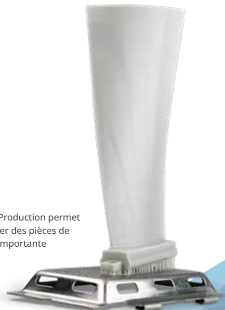
Figure 4 Production permet d'imprimer des pièces de hauteur importante

3D Connect Service fournit une connexion cloud sécurisée aux équipes de 3D Systems afin qu'elles puissent assurer une assistance proactive et préventive et proposer un service plus efficace, améliorer la durée de fonctionnement et garantir la capacité de production de votre système.