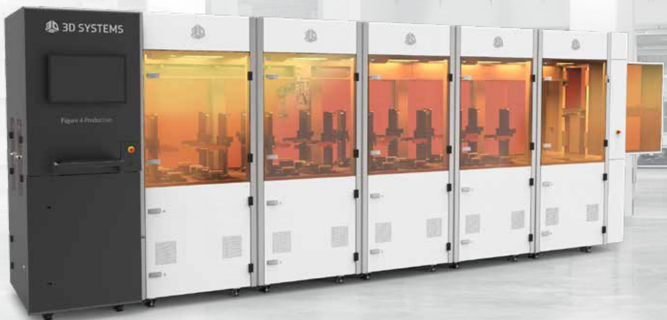
Figure 4 Production combine la flexibilité de conception de la fabrication additive dans des cellules de production en ligne configurables, afin de fournir une solution de production 3D directe personnalisable et automatisée.

Première solution d'usine personnalisable et pleinement intégrée pour la production numérique directe